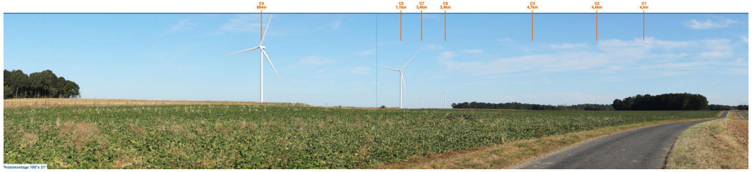
Photomontage n°54 : Arrivée par la N4, à l'Est de Courgivaux