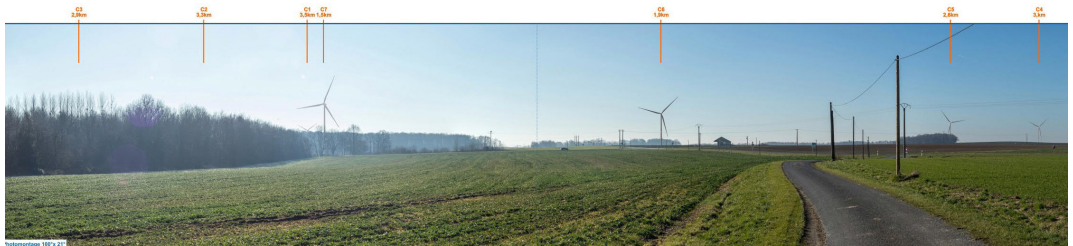
Photomontage n°48 : Depuis le village d'Aulnay, à Neuvy