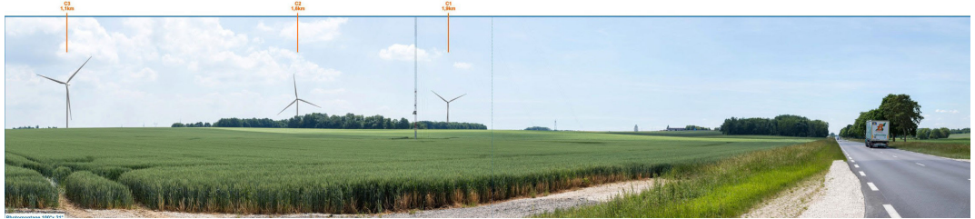
Photomontage n°36 : Depuis l'Est de Baleine