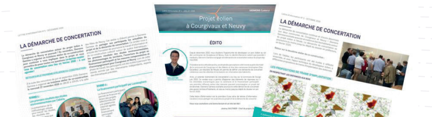
Les lettres d'information